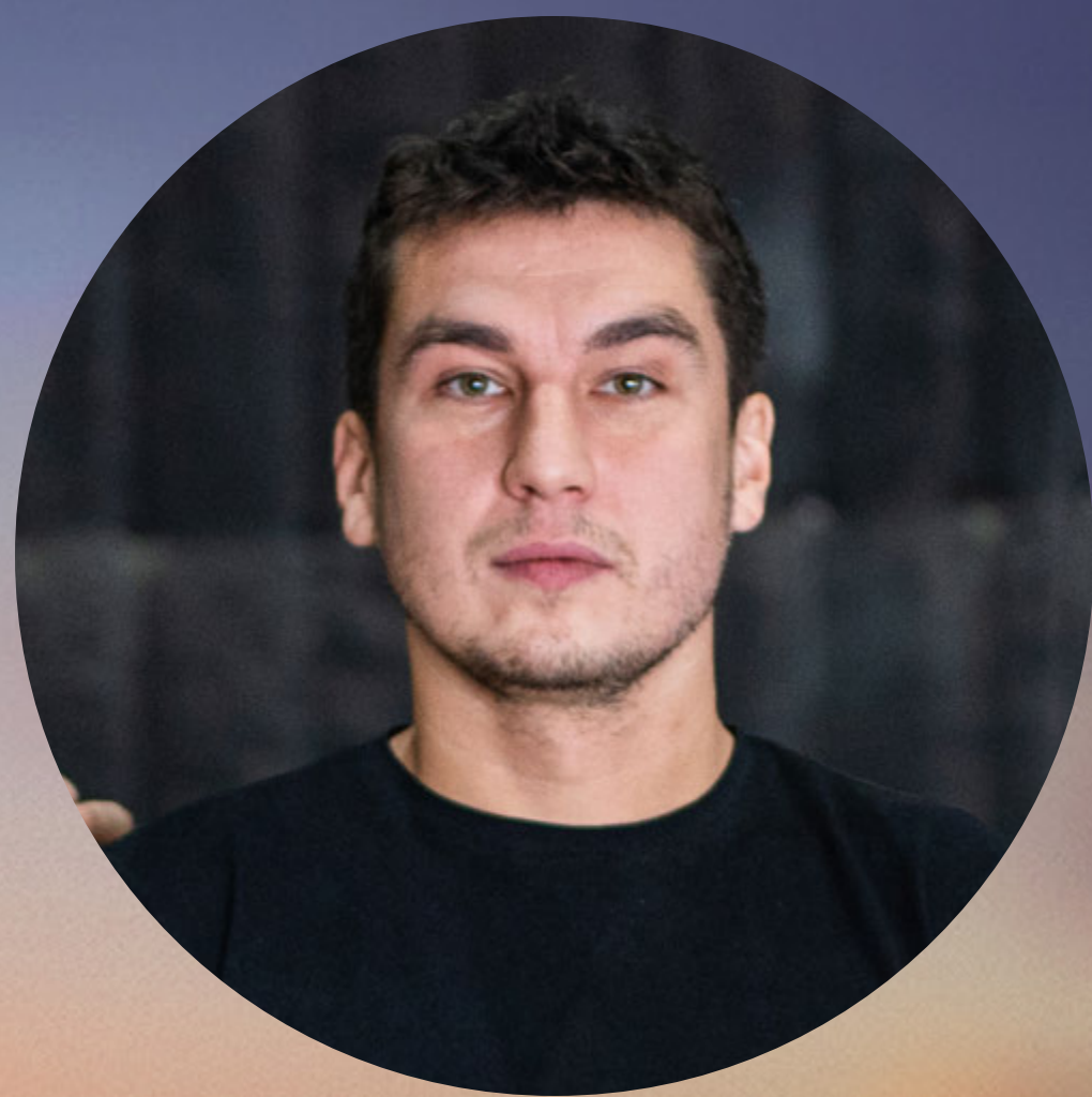
РОМАН КАРИМОВ РЕЖИССЁР

« ДЛ Я МЕН Я ЭТО КИНО О ТОМ, КАК ЛЮДИ НЕ СДАЛИСЬ — ВЕРИЛИ В ЛУЧШЕЕ И ПОНИМАЛИ, ЧТО ВЗАИМОПОМОЩЬ ПРИВЕДЁТ К СПАСЕНИЮ. »