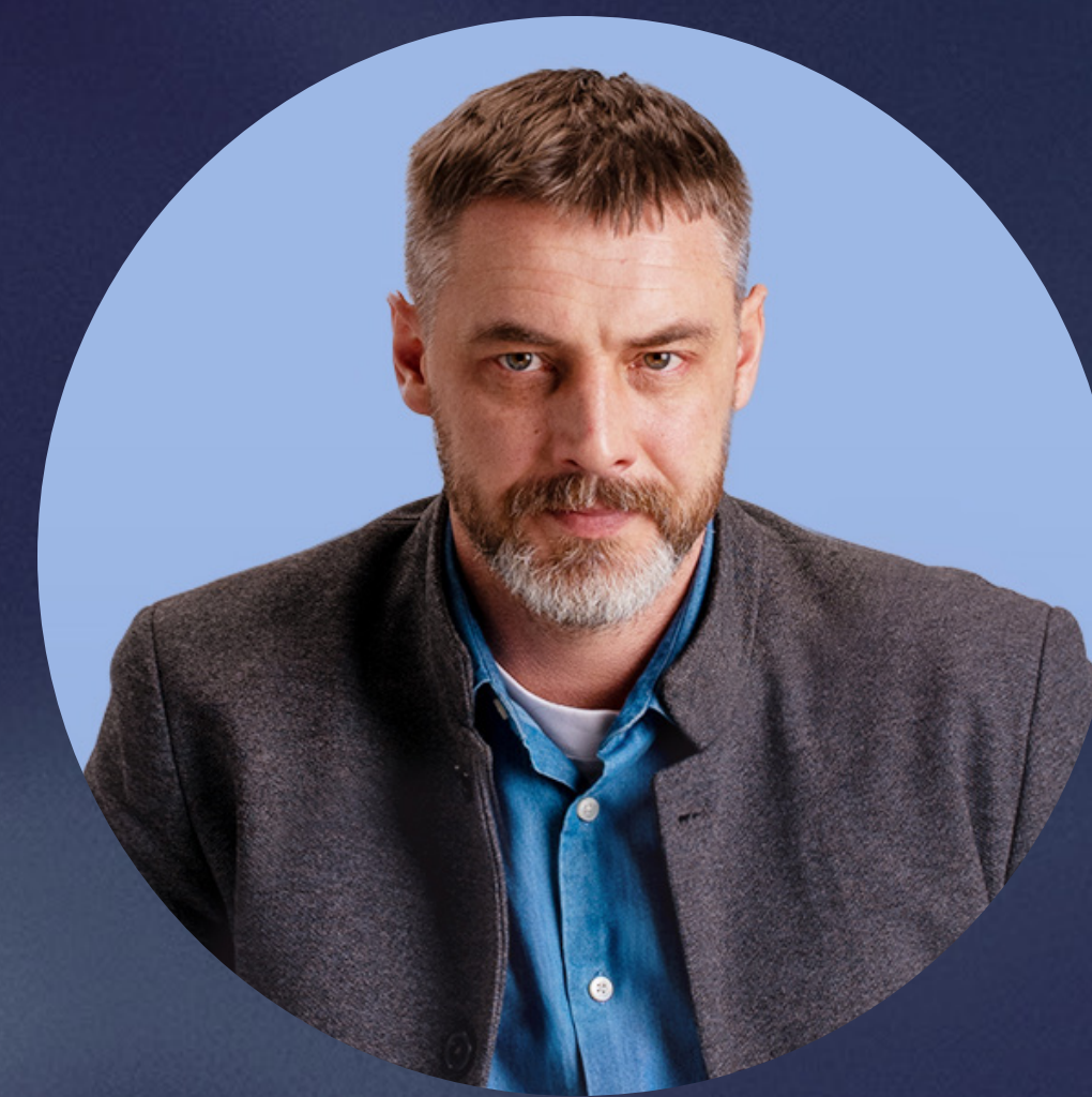
АНТОН БАТЫРЕВ АКТЁР

« ДЛ Я МЕН Я ЭТО КИНО О ТОМ, КАК ЛЮДИ НЕ СДАЛИСЬ — ВЕРИЛИ В ЛУЧШЕЕ И ПОНИМАЛИ, ЧТО ВЗАИМОПОМОЩЬ ПРИВЕДЁТ К СПАСЕНИЮ. »