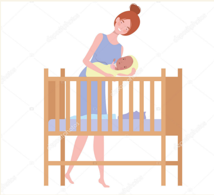
Младенец должен находиться под присмотром взрослых