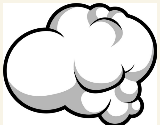
Не допускайте курение в квартире, где проживает ребенок. Дети курящих матерей в 5 раз чаще подвержены риску внезапной смерти