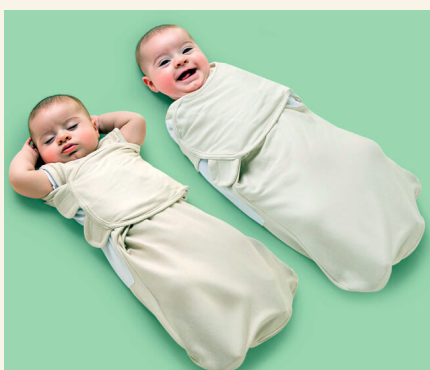
Используй свободное пеленание