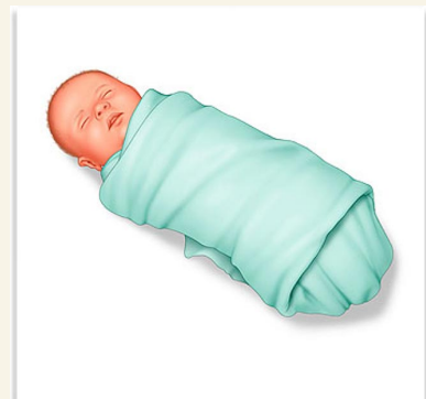
Не используйте тугое пеленание