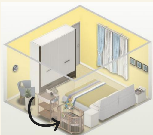
Детская кроватка должна стоять в спальне родителей Не кладите в кроватку мягкие игрушки, подушки, бортики Оптимальная температура воздуха в спальне +20-22 °С