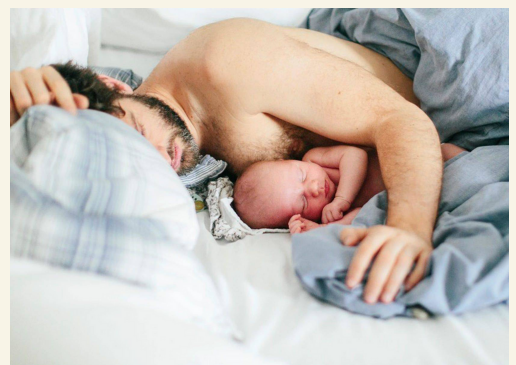
Не кладите ребенка в одну кровать с собой или старшими детьми